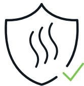
Protección ante gases